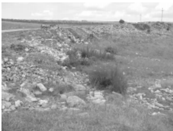
Imaginea 2 : Poluarea .....