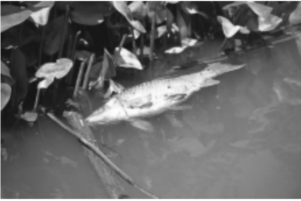
Imaginea 3 : Poluarea .....