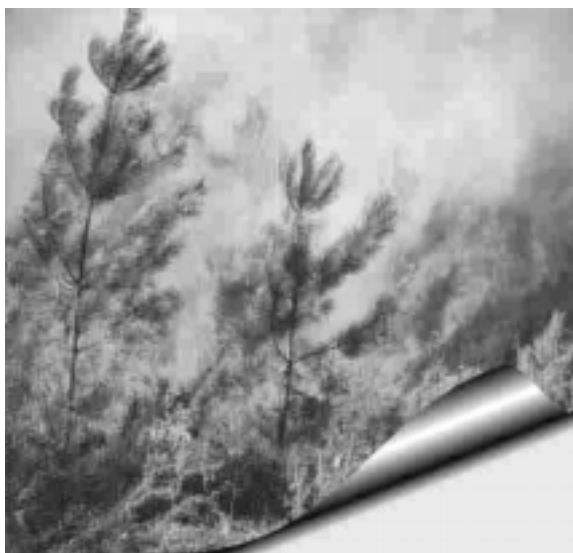
Imaginea 1 : Poluarea .....

Sarcina : Urmărește cu atenție prima parte a documentului video și identifică cel puțin două cauze ale poluării aerului, solului, apelor: